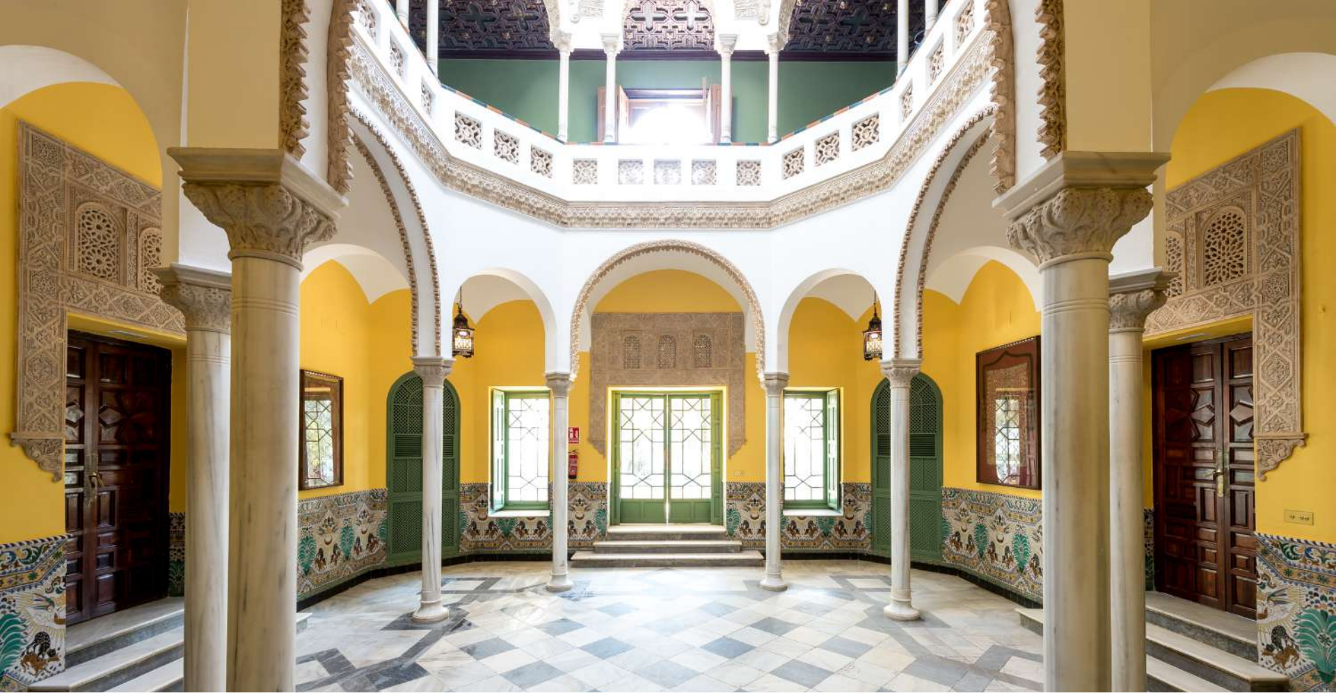
Patio de las Columnas / The Columns Patio

□ 82m 2 | 8,90m. ☀ 60 | 108 🏠 25 🏠 89 🌐 163