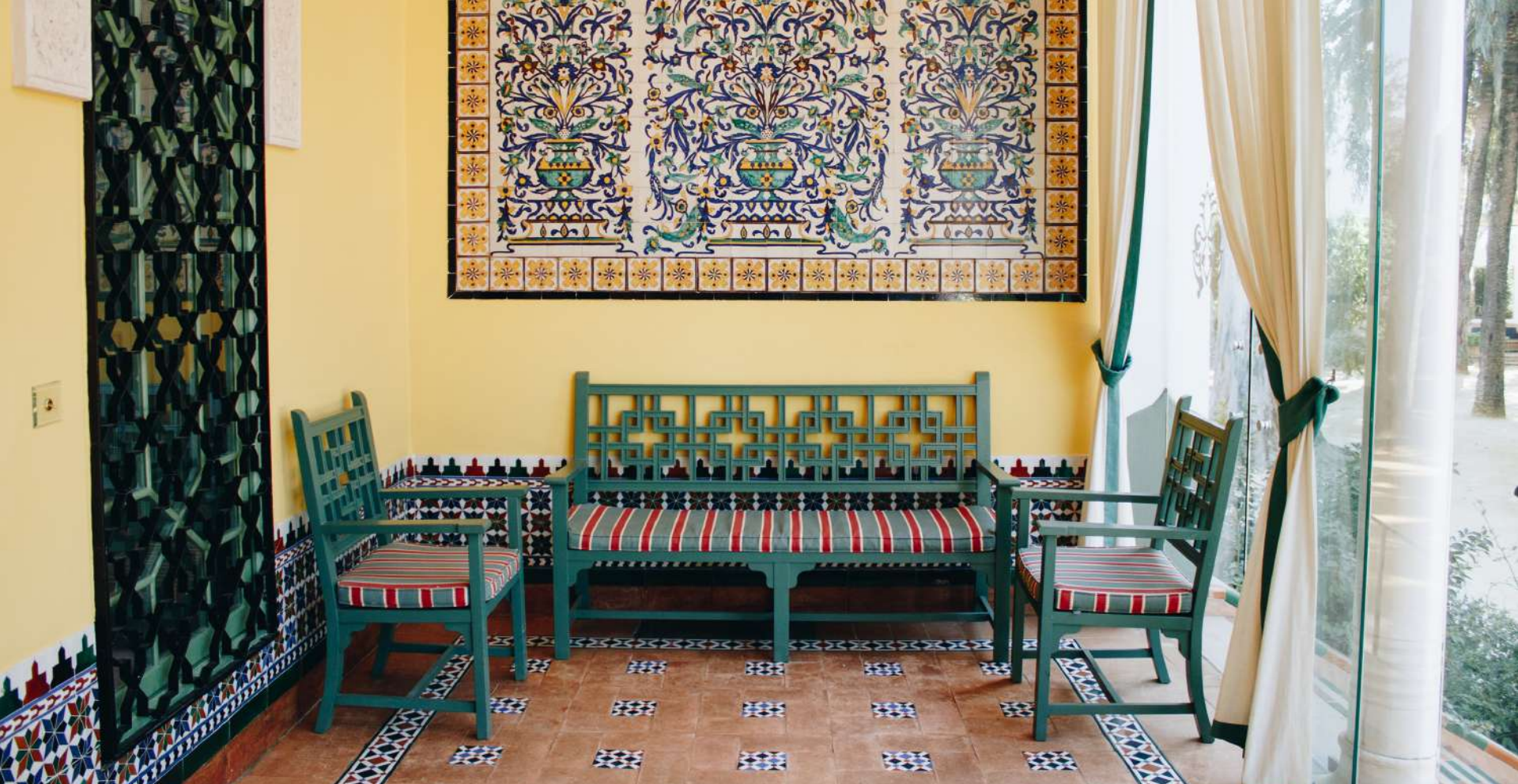
Atrio / Atrium